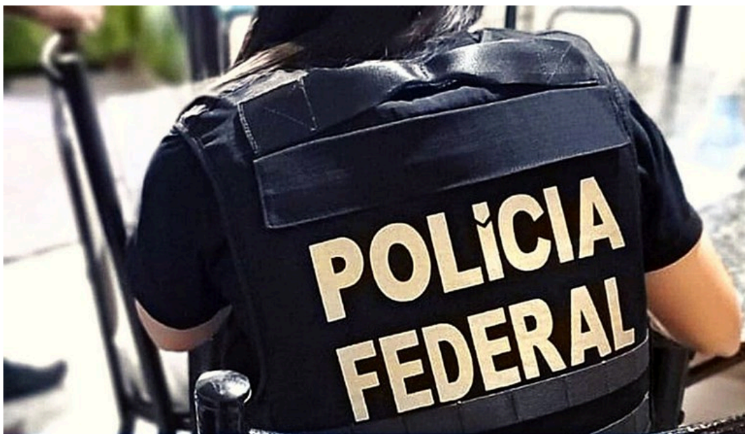
Imagem de arquivo

Dourados/MS: A Polícia Federal deflagrou, na manhã de hoje, 18/06, a Operação Mercadores da Inocência, para o cumprimento de quatro mandados de busca e apreensão no estado de São Paulo.